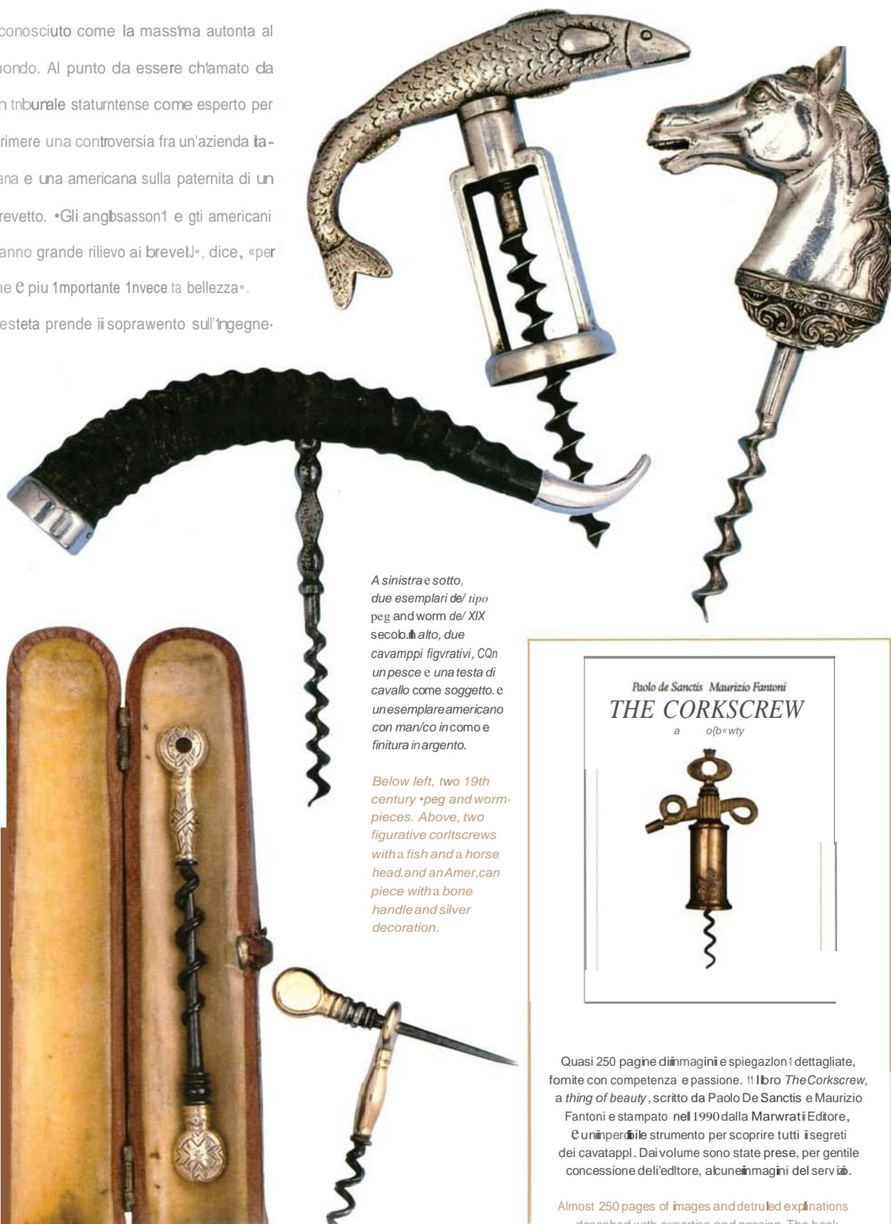
A sinistra e sotto, due esemplari del tipo peg and worm del XIX secolo. In alto, due cavappi figurativi, con un pesce e una testa di cavallo come soggetto, e un esemplare americano con manico in corno e finitura in argento.

nonosciuto come la massima autorità al mondo. Al punto da essere chiamato da un tribunale statunitense come esperto per dirimere una controversia fra un'azienda italiana e una americana sulla paternità di un brevetto. «Gli anglosassoni e gli americani danno grande rilievo ai brevetti», dice, «per me è più importante invece la bellezza». L'esteta prende il sopravvento sull'ingegnere.