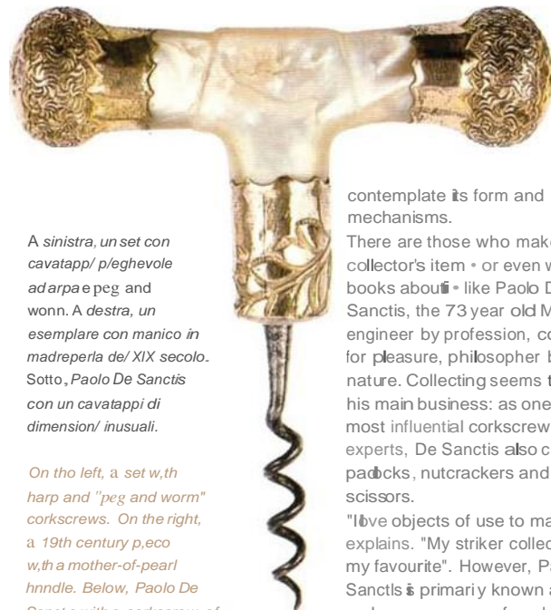
A sinistra, un set con cavatappi/peghevole ad arpa e peg and worm. A destra, un esemplare con manico in madreperla del XIX secolo. Sotto, Paolo De Sanctis con un cavatappi di dimensioni inusuali.