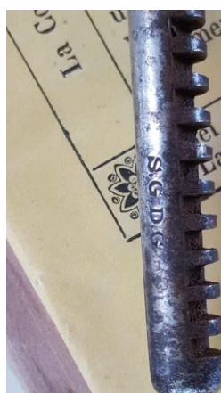
1) Cavatappi "Gasoline Pump" brevettato 1911 da Jules Vaney. Questo cavatappi è marcato sia D.R.P.G che S.G.D.G.