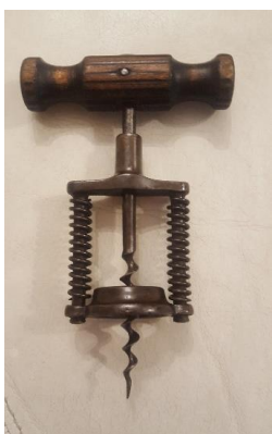
2) Cavatappi tedesco a 2 molle brevettato nel 1894;