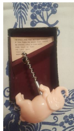
6) Cavatappi figurativo inglese (marcato MADE IN ENGLAND) in bachelite?? con verme sinistrorso (leggete il biglietto)