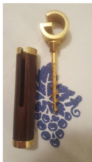
5) Cavatappi tascabile Gucci anni '60;